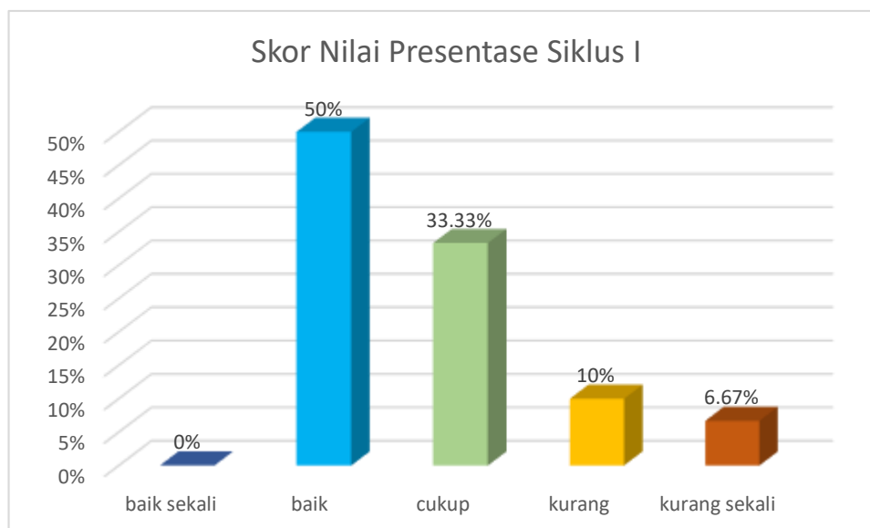
Gambar 4.1 Diagram Batang Skor Nilai Presentase Siklus I

Dari tabel 4.22 dan gambar 4.2 tersebut dapat disimpulkan bahwa dari 30 jumlah peserta didik kelas V terdapat 15 orang yang memperoleh kategori Baik dan kriteria tuntas dengan presentase 50%. Kemudian, terdapat 10 orang yang memperoleh nilai dengan nilai kategori cukup tetapi pada kriteria penilaian tidak tuntas dengan presentase 33,33%, murid dalam kategori kurang terdapat 3 orang kriteria penilaian tidak tuntas dengan presentase 10%. Sedangkan terdapat 2 orang kriteria penilaian tidak tuntas dengan kriteria sangat kurang presentasinya 6,67%. Jadi, nilai yang di peroleh di atas KKM 75 di katakana tuntas , dan di bawah KKM dikatakan tidak tuntas.