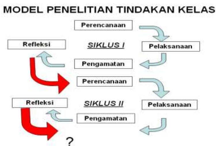
gambar 3.1 : model penelitian tindakan kelas bentuk siklus.

Alur tindakan kelas ini dilaksanakan dalam dua siklus kegiatan dengan perincian sebagai berikut :