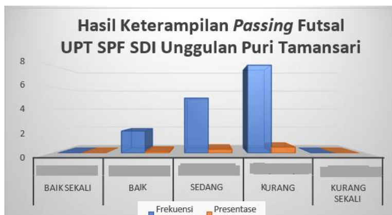
Gambar Diagram Batang Tingkat Keterampilan Teknik Dasar Passing Pada Permainan Futsal Siswa UPT SPF SDI Unggulan Puri Tamansari